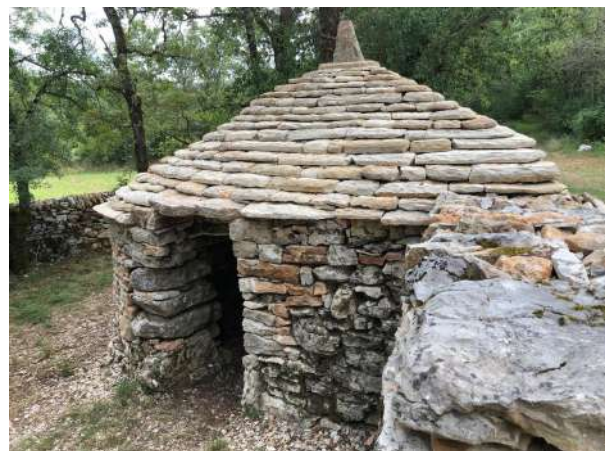
Restauration de « la cabane n° 6 » par l'association Découverte et sauvegarde du patrimoine de Limogne, à voir route de Cayrou Gros