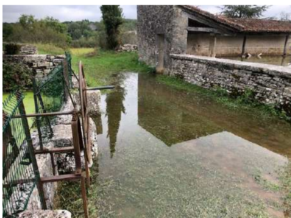
Limogne, Grand lavoir

21 interventions des pompiers, des caves submergées, des toitures ou des murs qui laissent passer l'eau, des chemins un temps impraticables... Le calcaire du Causse qui, habituellement, absorbe trop vite les pluies, n'y parvenait pas. En témoignent les images recueillies par nos reporters d'un jour.