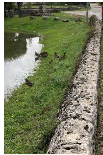
Limogne, route de Vidailiac

Le Limogne infos - La Gazette - Magazine édité par la mairie de Limogne. La commission communication remercie tous les contributeurs. Rédaction : Christophe Wargny. Conception : Jean Luc Bouchard. Directeur de la publication : Jean-Claude Vialette, maire. Impression : Imprimerie Boissor, ESAT (Etablissement et service d'aide par le travail), Luzech. Tirage : 600 exemplaires.