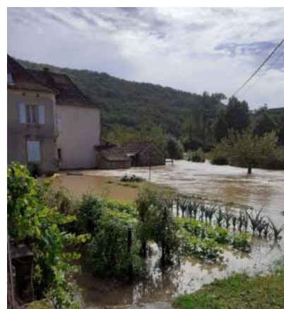
Cénevières, bord du Girou