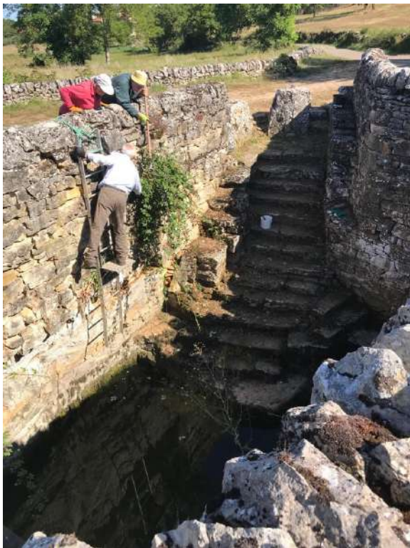
Fontaine de Malecargue: que ne faut-il pas faire pour entretenir le petit patrimoine !

S'agit-il d'une révision seulement ? En réalité, les réflexions menées sont encadrées par le schéma de cohérence territoriale (SCOT) qui donne un cadre de travail. Le Projet d'aménagement et de développement durable (PADD) ajoute les éléments chiffrés à prendre en compte. Pour faire simple : nous devons rechercher une augmentation de la densité de l'habitat ou réduire la dispersion. Cela signifie que la réduction des surfaces constructibles va être très forte par rapport au PLU existant.