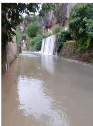
Cénevières, route de Limogne